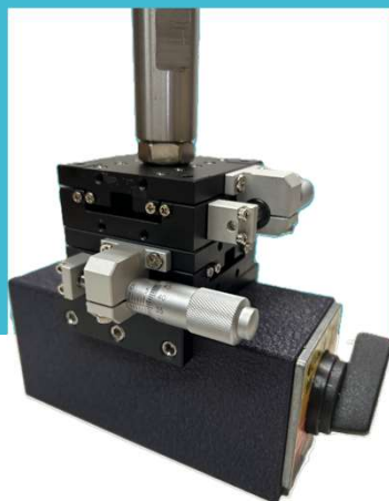
マグネットベースにセット

おれと～るで小径（M2～M6）の芯合わせが容易になるクロステーブルアタッチメントで、ご使用中のマグネットベースに簡単に取付けられます！！