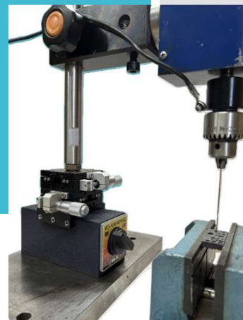
小径タップに芯合わせ中