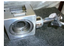
マグネット側の測定