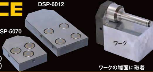
ワークの端面に磁着

DSP-5070→(HDC 80用.MG-3ヶ) DSP-6012→(HDC150用.MG-4ヶ)