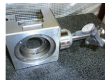
マグネット側の測定